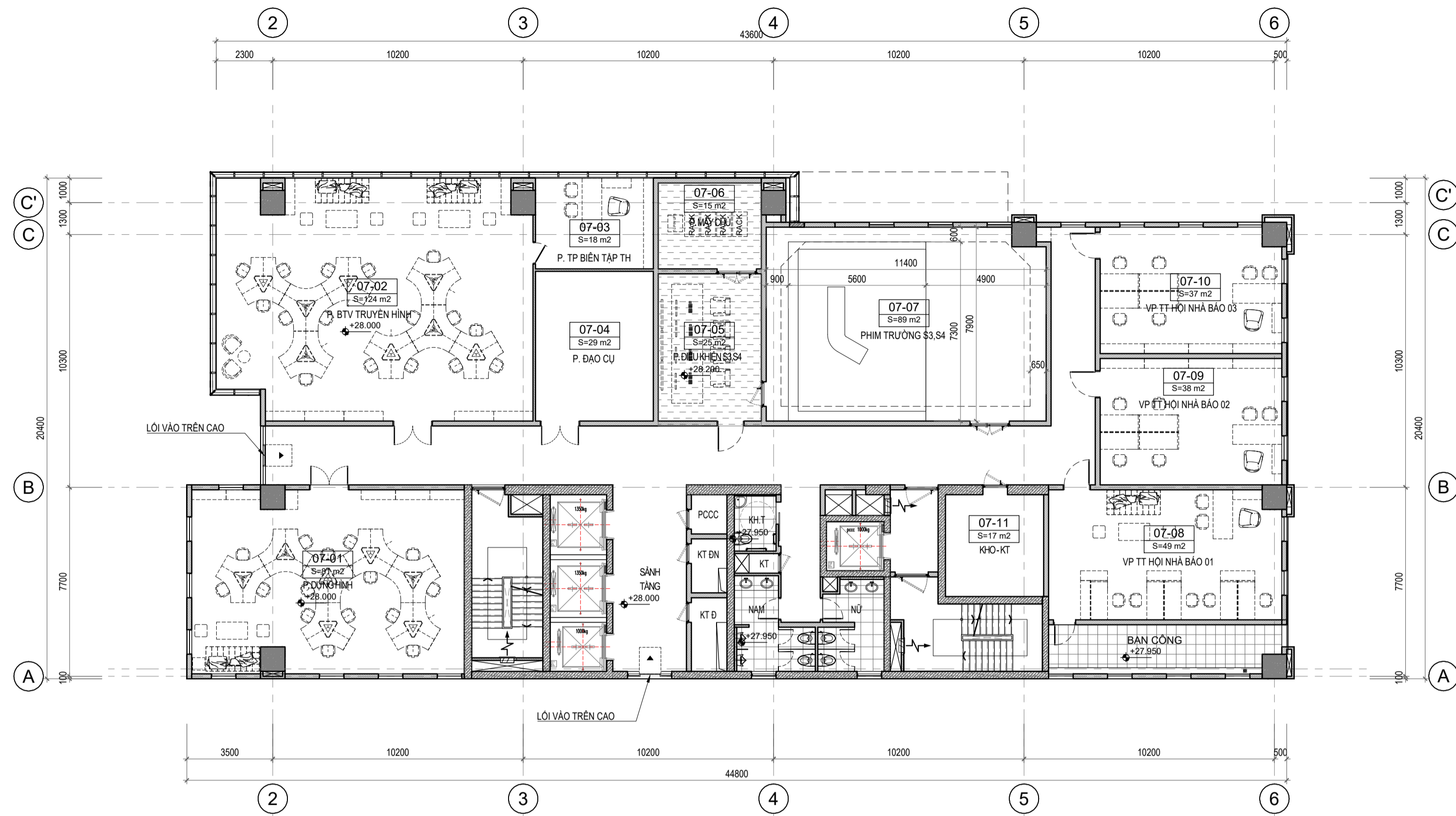
MẶT BẰNG TẦNG 7 Scale: 1/150